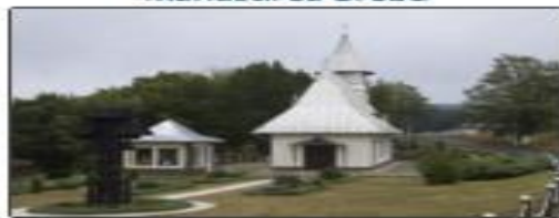
Schitul de pe Muntele Mic