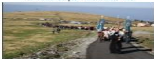
Schitul Poiana Mărului